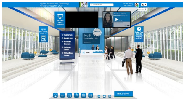
ロビー (ログイン時のスタート画面)