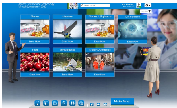
ブレイクアウトルーム (分野別のアプリケーション集・動画)