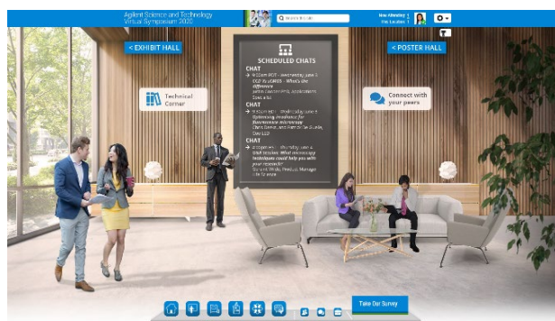
ネットワーキングルーム (テーマ別チャット・個別チャット)