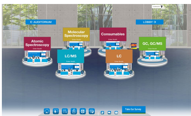
装置別展示ブース (装置・消耗品バーチャル展示)