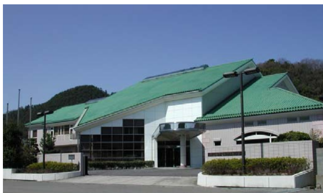
岡山セラミックスセンター