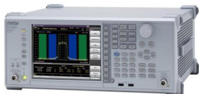
標準価格：約199万円～（3.6GHzモデル）

デジタル&アナログの業務無線の送信&受信の特性評価に！（電波法・登録点検、受信感度など） スペクトラムアナライザ・パワーセンサ・周波数カウンタ・信号発生器・BER機能・オーディオアナライザ/ジェネレータ を1台に搭載。さらに自動測定で負荷軽減&時間短縮。