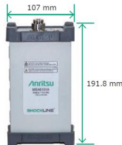
～43.5 GHzまでのアンテナ評価に