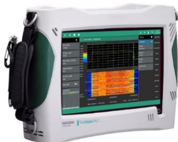
標準価格：約367万円～（9GHzモデル）