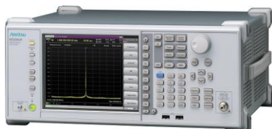
標準価格：約543万円～（26.5GHzモデル）

C帯/X帯 一次レーダ等の送信特性評価や、5/6GHz帯 無線LANのスプリアス評価など